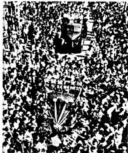
长春一汽生产的第一批解放牌汽车

7月13日上午8时半，汽车总装配工作开始，工人、技术员和干部，怀着十分兴奋又紧张的心情，走到总装配线两旁自己的工作岗位上。150米长的总装配线缓缓地向前转动，工人们按顺序将汽车的部件一一进行安装。装配线转到终端时，一辆崭新的深绿色解放牌汽车出现了。早已等候在那里的汽车司机，立即跨进驾驶室，把汽车徐徐地开出了装配车间，万余名工人夹道欢呼，欢呼第一辆国产汽车诞生了。