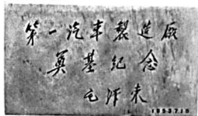
毛泽东为第一汽车制造厂题词的奠基石

在旧中国，公路上跑的汽车没有一辆是我国自己制造的。连修理汽车的零件，也从外国进口。中国人渴望有自己的汽车制造厂，生产出自己的汽车。1956年，一座宏伟的汽车城——第一汽车制造厂，在长春近郊建立起来了。